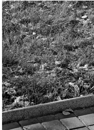
南京今冬第一场雪还没完全化,第二场雪又要来了