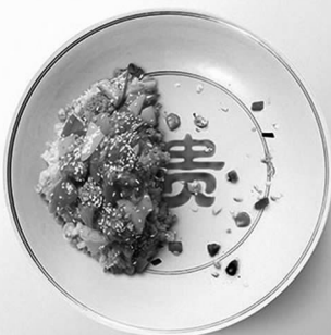
俭以养德 杜绝浪费