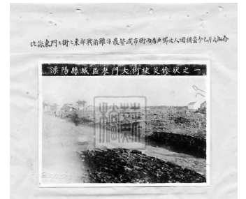
溧阳县城区东门大街被灾惨状

不仅仅是在南京,侵华日军在江苏境内破坏、焚毁、强占江苏境内许多名胜园林、文物古迹、寺庙、图书馆、博物馆以及学校校舍等,类似情形比比皆是:中国第一座博物馆——南通博物苑,收藏古今珍物、石刻文物,遭侵华日军洗劫后,只剩一尊大铁佛和少数石马,其余都不见踪迹;历史古城扬州有14座庙宇遭严重破坏,加上文物损失无法估算;连云港灌云板浦的崇庆院、盐义仓、“二许”故居等古建筑群遭日机轰炸最后成了一片废墟;仅溧阳一县,据1992年所修县志统计,抗战期间,被毁古建筑即达497处之多……全面抗战爆发后,江苏省境内许多学校纷纷搬迁或停办,遭受严重损失。没有搬迁的普遍遭到轰炸、纵火、抢劫,校舍被毁,器物被劫。劫难后的校址,多成了侵华日军的军营和用以关押抗日爱国人士的监狱。教师失业,学生失学,学业荒废……以苏州为例,1938年学校数量较1937年减少195所,学生减少33065人。常熟沦陷期间,敌伪辖区的小学锐减为50余所,仅及战前的四分之一。