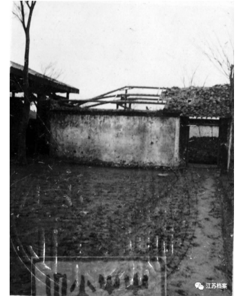
江苏省南通中学校舍全部被毁照片(江苏省档案馆馆藏)

不仅仅是在南京,侵华日军在江苏境内破坏、焚毁、强占江苏境内许多名胜园林、文物古迹、寺庙、图书馆、博物馆以及学校校舍等,类似情形比比皆是:中国第一座博物馆——南通博物苑,收藏古今珍物、石刻文物,遭侵华日军洗劫后,只剩一尊大铁佛和少数石马,其余都不见踪迹;历史古城扬州有14座庙宇遭严重破坏,加上文物损失无法估算;连云港灌云板浦的崇庆院、盐义仓、“二许”故居等古建筑群遭日机轰炸最后成了一片废墟;仅溧阳一县,据1992年所修县志统计,抗战期间,被毁古建筑即达497处之多……全面抗战爆发后,江苏省境内许多学校纷纷搬迁或停办,遭受严重损失。没有搬迁的普遍遭到轰炸、纵火、抢劫,校舍被毁,器物被劫。劫难后的校址,多成了侵华日军的军营和用以关押抗日爱国人士的监狱。教师失业,学生失学,学业荒废……以苏州为例,1938年学校数量较1937年减少195所,学生减少33065人。常熟沦陷期间,敌伪辖区的小学锐减为50余所,仅及战前的四分之一。