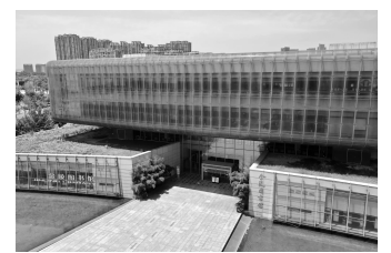
现在的金陵图书馆

又到一年银杏季,金灿灿的树叶铺满了金陵图书馆门前的银杏里。亮堂、现代化的馆舍,依傍着河西滨江地区,与旁边的江苏大剧院一起,构成了南京的文化新地标。如果没有86年前那场浩劫,金陵图书馆还将拥有一座底蕴深厚的老馆,就在“最南京”的老城南,在人流拥挤的夫子庙。金陵图书馆是南京市级图书馆,其前身是南京市立图书馆,创立于1927年6月9日,借原平江府布道所为馆址,后来迁入泮宫。据1934年1月出版的《南京市立图书馆概况》:“本馆馆舍,系就夫子庙泮宫布置。正殿为阅览室,东庑七间为藏书室,二间为出纳处。西庑四间为阅报室,二间为儿童阅览室,三间为报志储藏室。”1937年12月13日,日军占领南京后,放火将泮宫连同市立图书馆烧毁,图书大多焚毁殆尽,也有说遭炮火而毁。