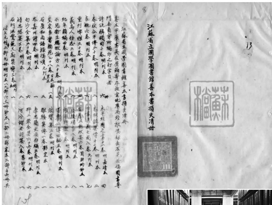
江苏省立图书馆善本书损失清册(江苏省档案馆馆藏)