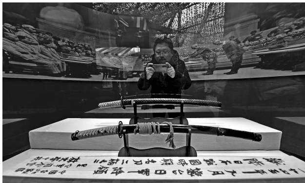
侵华日军投降时献降的军刀