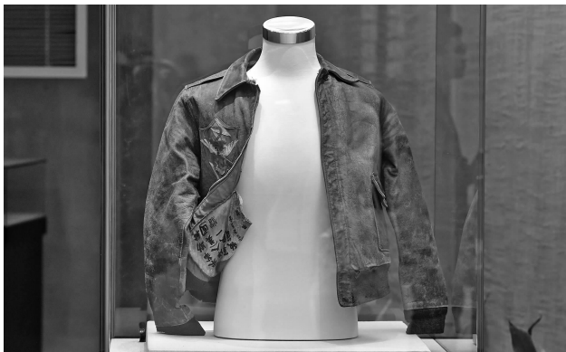
美国飞虎队队员曾经穿过的飞行夹克