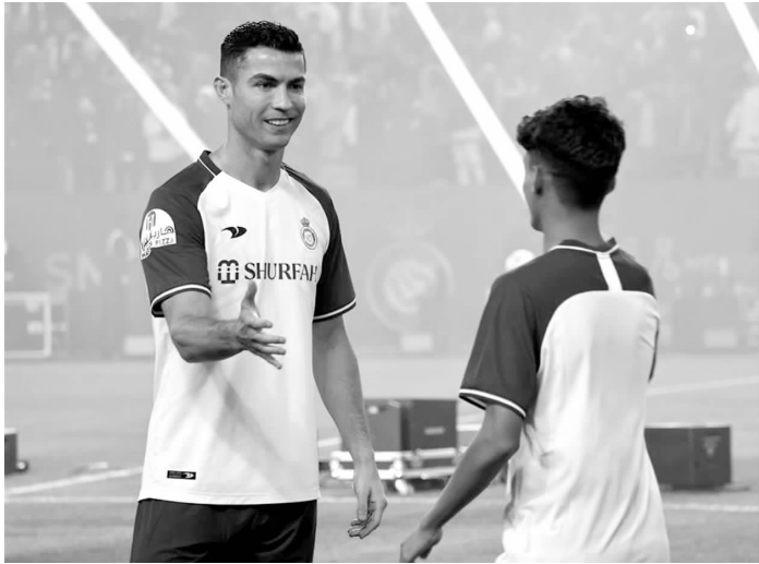
C罗（左）有望代表利雅得胜利队赴华比赛