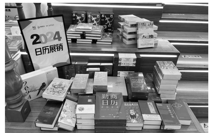
书店里的日历展台

本报讯(记者 王益)又到岁末，新一年的日历开始销售了。现代快报记者探访发现，有的商家和知名IP合作出联名款，有的主打公益捐款，还有的通过各种精美周边吸引消费者。博物馆、美术馆、咖啡店、书店、动漫……总有一款戳中你的“心巴”。