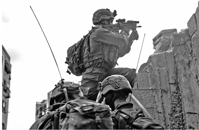
这张以色列国防军12月10日发布的照片显示,以军地面部队在加沙地带进行军事行动

美国国务院同一天说,美国政府已批准总额超过1亿美元的“紧急”对以军售。美国政府认定的“紧急”军售可绕过国会审查。依照美国媒体说法,这种方式虽有前例,但堪称“罕见”。