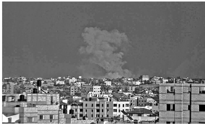
12月9日,浓烟从加沙地带南部城市汗尤尼斯一处被炸地点升起

美联社以联合国世界粮食计划署为消息源报道,在加沙地带北部,九成人自述曾至少一天一夜无