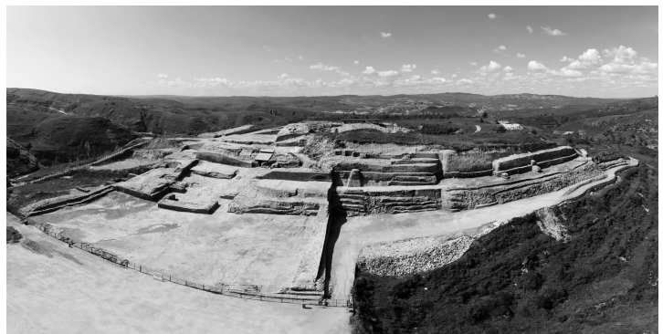
陕西神木石峁遗址