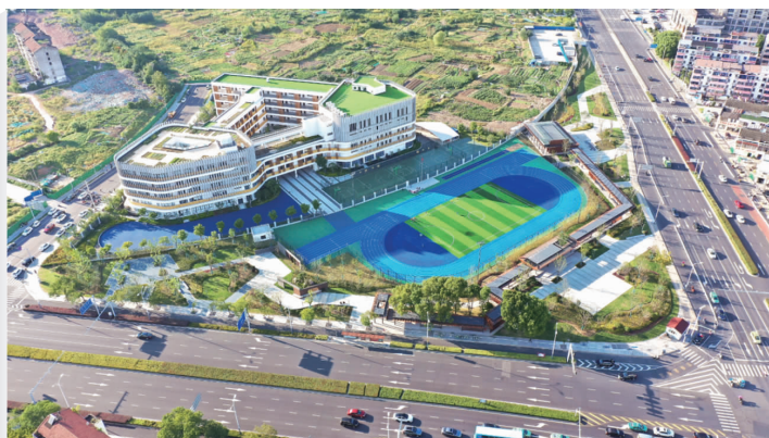
天宁区景仁公园

据悉,常武路武南路西北角口袋公园,场地外圈是深1.2米的大碗池,中间是深1.5米的小碗池,结合室外街区区域,以丰富的道具、宽敞的场地,扩展使用人群的多元化。该口袋公园还增设了适合儿童的攀岩区域,以及可供市民休息、阅读、如厕的便民驿站,整体打造环境舒适的社区空间,为社区生活赋能。