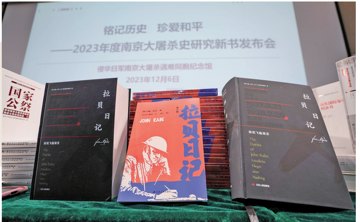
新书发布会现场