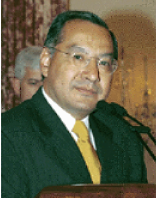
维克托·曼努埃尔·罗查

美国司法部4日发表声明,指控退休外交官、前驻玻利维亚大使维克托·曼努埃尔·罗查为古巴从事间谍活动40余年。罗查已于本月1日在迈阿密家中被捕。