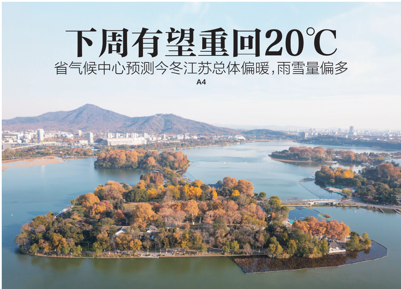
12月1日，南京玄武湖公园色彩斑斓，景色如画