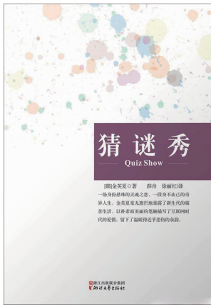
「韩」金英夏著 薛舟 徐丽红译 《猜谜秀》 浙江文艺出版社