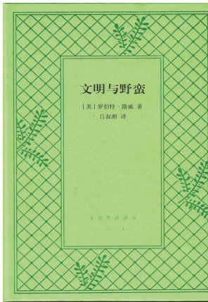
「美」罗伯特·路威著 吕叔湘译 《文明与野蛮》 生活·读书·新知三联书店