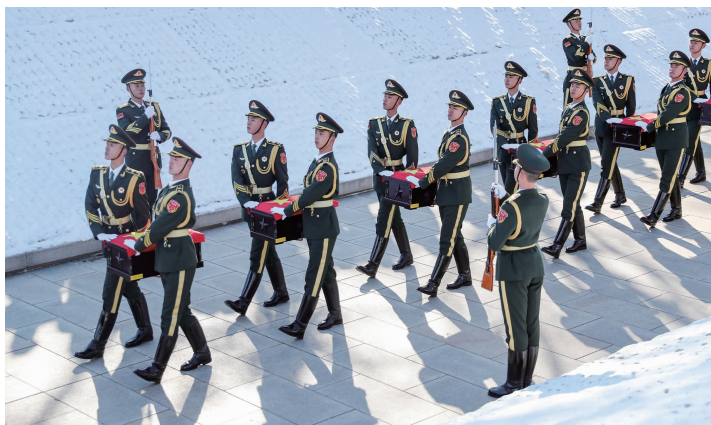
11月24日,第十批在韩中国人民志愿军烈士遗骸安葬仪式在沈阳举行

“桓桓将士,请命远征。冲锋陷阵,奋不顾身。”退役军人事务部部长裴金佳致悼词时说,“中国人民志愿军烈士永垂不朽!”