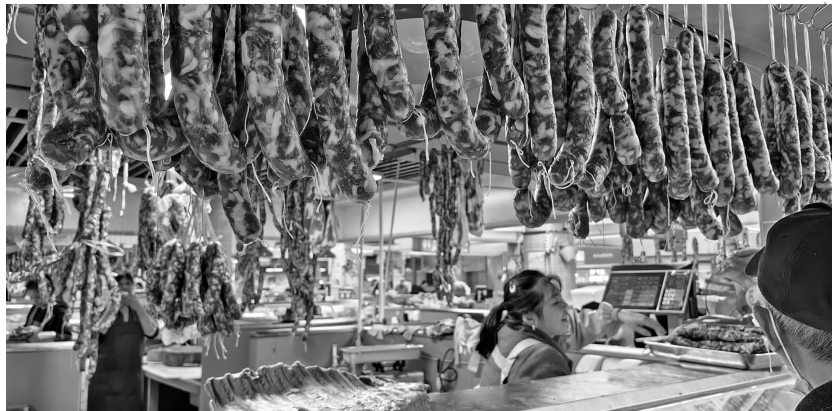
菜市场卖肉的摊位前挂满了香肠