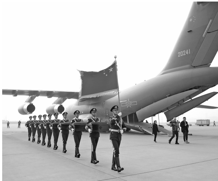
11月23日,在韩国仁川国际机场,中国人民解放军礼兵准备护送烈士棺椁登上解放军空军专机

中国退役军人事务部、中央宣传部、中央对外联络部、中央网信办、外交部、财政部、中央军委政治工作部等部门组成的中方交接代表团全体人员、驻韩国大使馆相关