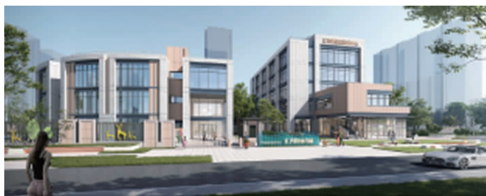
兴邦路特色街巷效果图

项目位于南部新城核心区,北至汇秀路,南至汇景南路,东临兴邦路特色街巷,西临规划居住用地。项目总用地面积约为10213.96平方米,分为三个分区,其中:A分区为公园绿地用地,用地面积2652.05平方米;B分区为基层社区中心用地,用地面积2100.03平方米,容积率≤2.0,建筑密度≤55%,建筑高度≤24米,绿地率≥20%;C分区为幼托用地,用地面积5461.88平方米,容积率≤1.0,建筑密度≤25%,建筑高度≤12