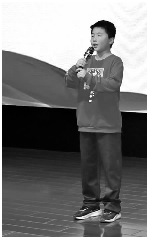
一名小选手在校园歌手大赛中演唱