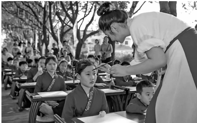
“宋韵文化之旅”现场为小记者朱砂启智

我跟着路标指示到达的现场,去签到处领取了汉服、小国旗还有三字经的卡纸,姐姐帮我穿好了汉服。主持人先讲解了这次活动的主题,