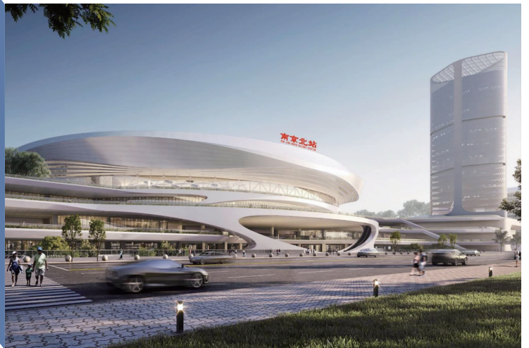
南京北站站房效果图