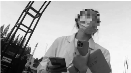
医院工作人员示意一手交钱一手交证