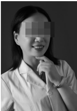
涉案叶姓院长及襄阳健桥医院