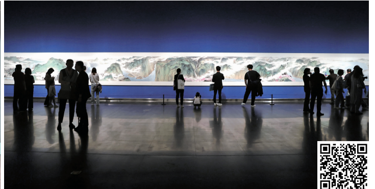
展出中的《长江春色图》 扫码看视频