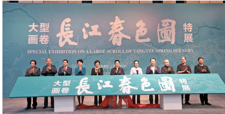
领导嘉宾为展览揭幕