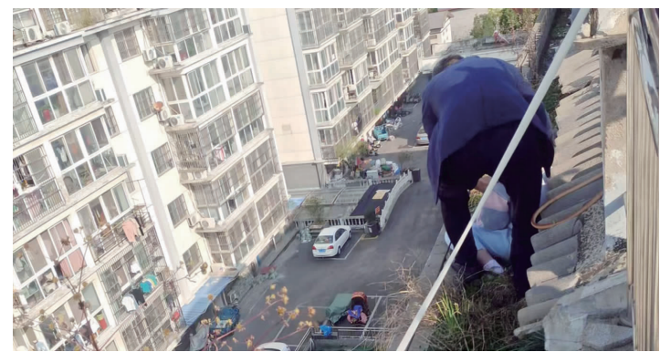
没做任何保护,刘兆利爬上阁楼顶部救人

刘兆利当即指挥社区同事一边向女孩喊话转移视线,一边让其他人帮忙托举,他从另一侧爬上阁楼顶部,抓住女孩转移视线的一刹那扑了过去,一把将女孩抱住,随后又在其他人的帮助下把女孩拉了回来。