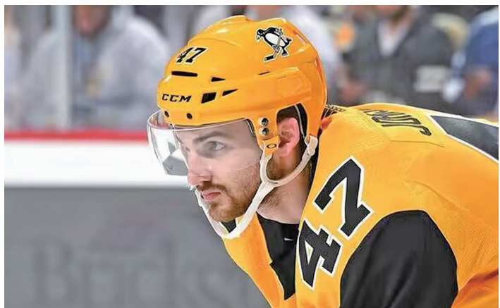
亚当·约翰逊