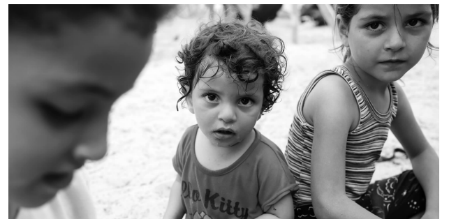
加沙地带南部城市汗尤尼斯一处临时营地内的巴勒斯坦儿童

保护记者委员会警告说,世界会因此失去了解巴以新一轮冲突“现实状况的窗口”,加沙地带将出现信息真空状态,这会助推虚假信息传播。