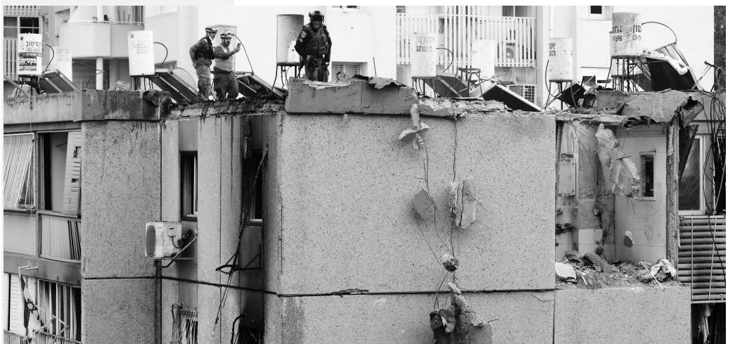
10月27日,在以色列特拉维夫拍摄的遭到火箭弹袭击的受损建筑