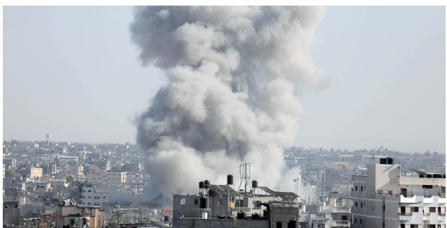
10月26日,以色列空袭造成的浓烟从加沙地带城市拉法城中升起

以色列国防军27日发表声明说,以军地面部队过去一天内对加沙地带进行了“有针对性的袭击”,这是以军连续第二天派遣地面部队袭击加沙地带。 声明说,在空中力量的配合下,以军地面部队袭击了巴勒斯坦伊斯兰抵抗运动(哈马斯)的部分军事目标,并打死一些哈马斯武装人员。行动结束后,以军撤离该地区。 以军26日早间发表过类似