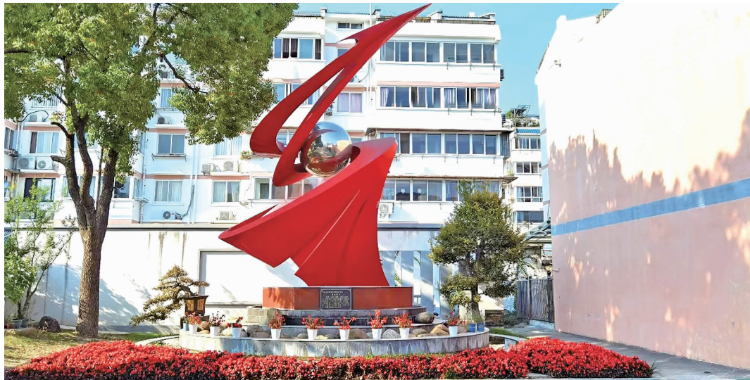
校园景色