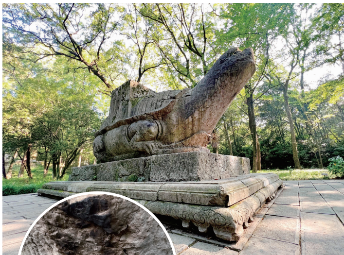
▲龟趺已被修复

尹霄飞一直期待能有更多关于这个石龟趺的考古发现，他呼吁广大游客，“在找到更多相关线索之前，我们一定要好好保护这件文物。”