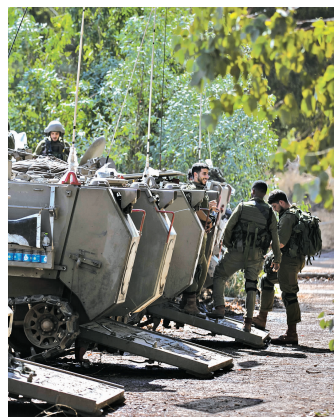
10月16日,在以色列黎巴嫩边境以色列一侧营地的以军战车和士兵