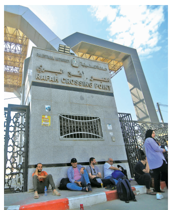
10月16日,人们在加沙地带南部的拉法口岸前等待撤离加沙地带