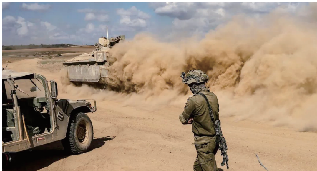
当地时间15日,一辆以色列装甲车在加沙边境附近田野上行驶

当地时间10月16日晚些时候,哈马斯(巴勒斯坦伊斯兰抵抗运动)发布了首段有关在10月7日的袭击中被劫持的人质视频。