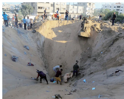
10月16日,在加沙地带南部城市汗尤尼斯,人们在遭以色列袭击后的建筑废墟中救援伤者

联合国近东救济工程处总干事拉扎里尼接受路透社采访时说:“加沙即将用尽水和电。实际上,加沙正在被掐死,似乎世界现在失去了人性。” 据新华社