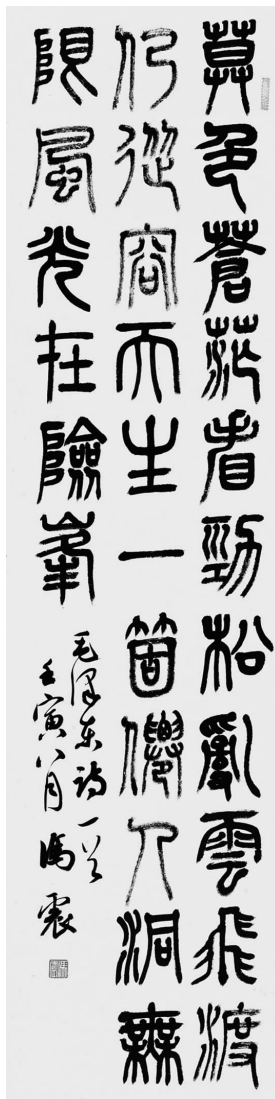
《毛泽东诗》134cm × 34cm