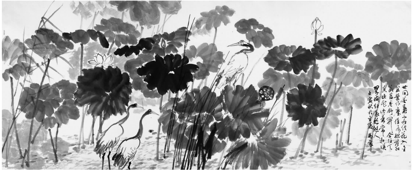
《清风荷韵》144cm × 365cm