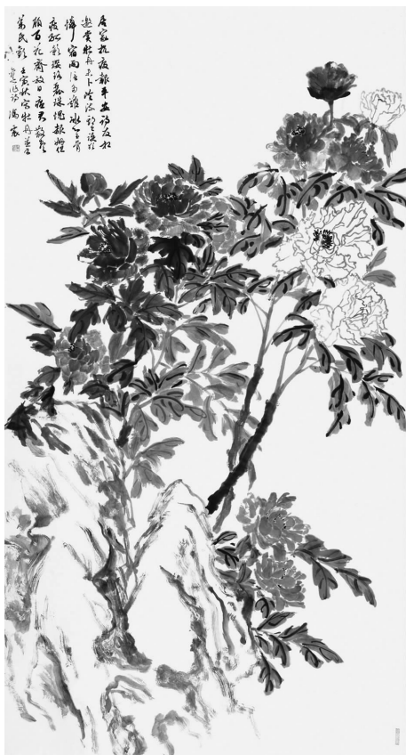
《水木清华》180cm × 97cm