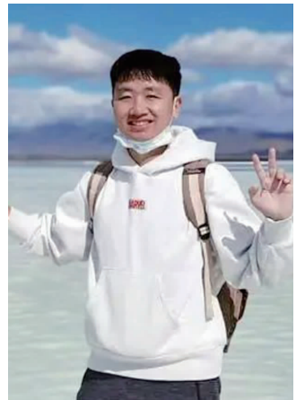
七月新番 据七月新番个人账号