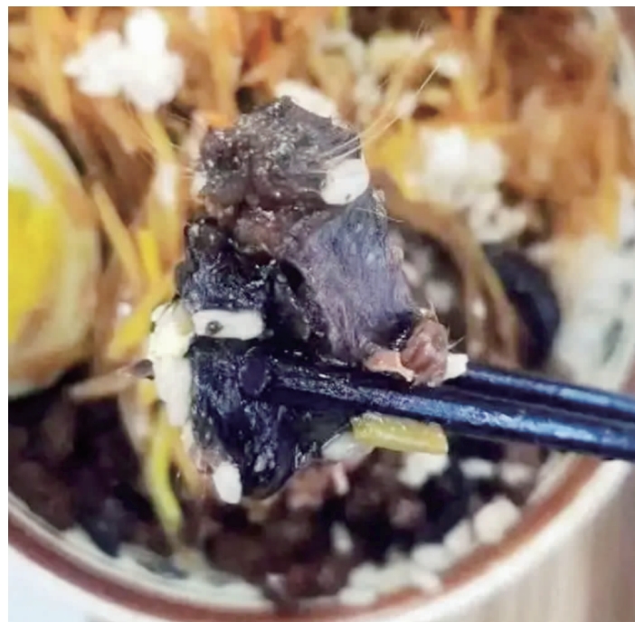
▶被发到网上的疑似鼠头照片

10月10日，有网友爆料称，位于河北唐山的华北理工大学，有学生吃出疑似鼠头的异物，该事件引发广泛关注。