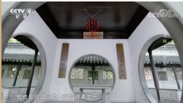
他也是拙政园的主要设计者之一