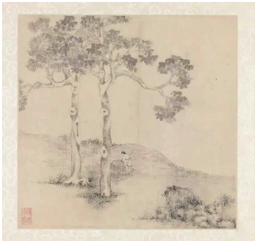
《拙政园三十一景图》之玉泉