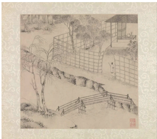
《拙政园三十一景图》之小沧浪