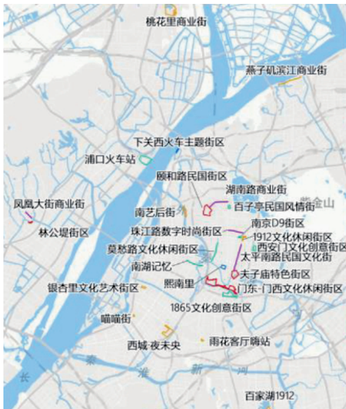
特色街区规划图(局部)

优化都市商业格局。加快新街口商圈向高端化、品牌化、国际化发展,提升国际影响力。加快元通商圈资源整合,高标准建设江北商圈,推动南站商圈与交通枢纽协同联动,共同提升都市商业能级。引导湖南路/中央