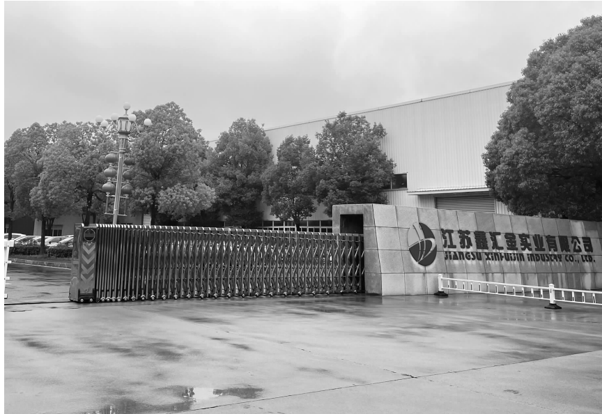
原悦达汇金的办公区域