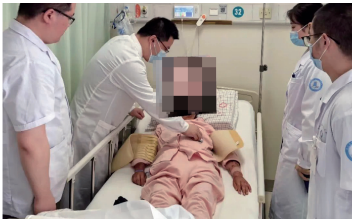
术后的周大妈正在康复中