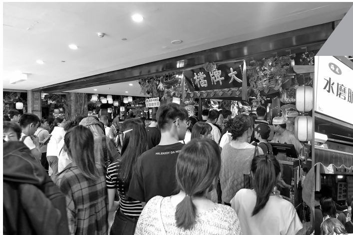
“味蕾游”打卡南京各种美食

“味蕾游”是这个假期很多年轻人的出游方式。去某个城市之前,早早就在社交平台做功课,了解特色美食,哪怕排队吃一顿也不枉这一趟出游。在南京新街口商圈的很多餐饮店门口,记者看到有不少消费者都是拎着大包小包,还有不少人