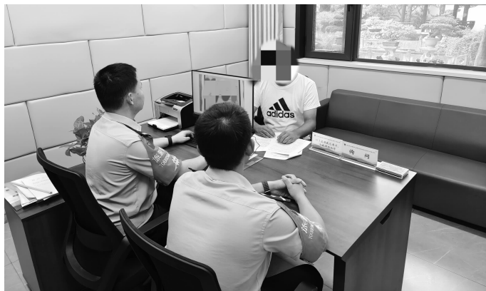
警方抓获倒票“黄牛”

据介绍，中国大运河博物馆本是免费面向公众开放的景点，但有些“黄牛”利用来扬游客对网络预约门票流程不熟悉、线上预约门票难、行程不确定等情况，将免费参观变成了为自己牟利的工具。9月21日至25日，扬州景区公安打掉