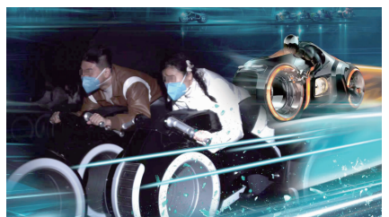
王同学被拍的照片