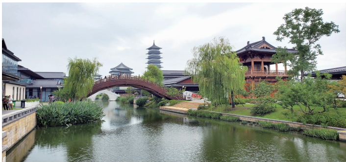
大运河非遗文化园一期

快报讯(记者 顾潇)作为大运河的原点城市和大运河申遗牵头城市,扬州与大运河共生共长。目前,大运河非遗文化园二期规划建设方案已经公示结束,项目沿线已经搭建施工围挡。根据规划,该项目将于明年年底建成。