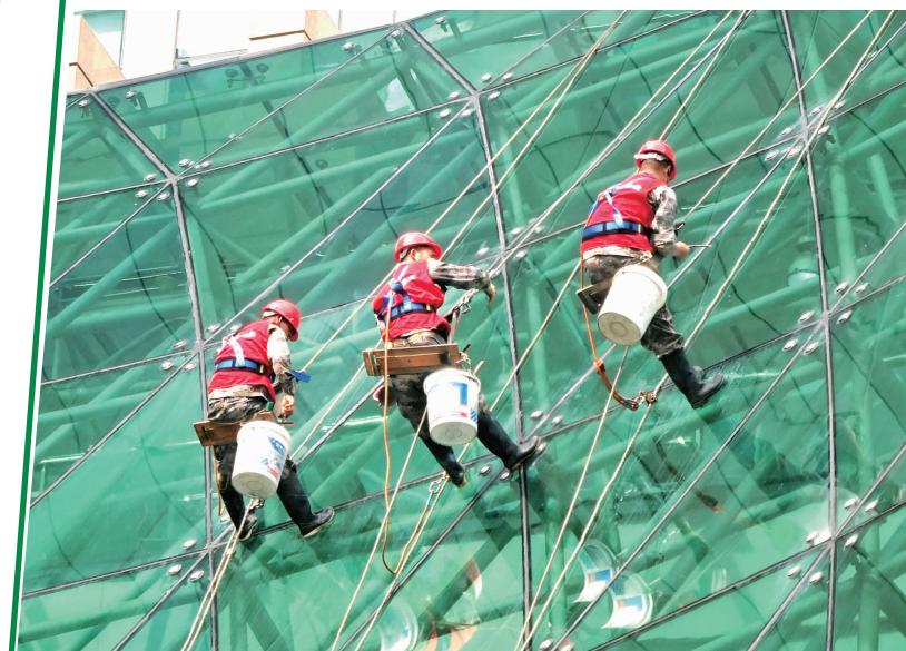
正在作业的“蜘蛛人”

据了解,一般楼宇清洗的责任人就是产权人,责任人也可以出资委托物业公司代为清洗,对于拒不清洗的责任人,可以处罚5000元到3万元。