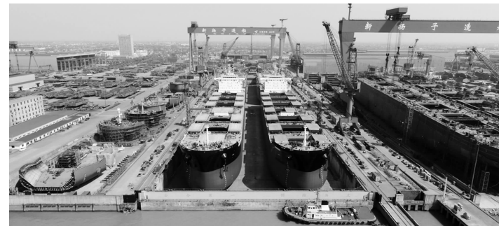
泰州是全国最大的民营造船基地

何建华说,上海大都市圈是对标纽约大都市圈、东京湾区的世界级城市群,是通过都市圈来推动一体化发展,核心是打破行政壁垒,优化资源整合,提高效率,长三角区域一体化核心是做强区域经济来参与世界竞争。泰州加入上海大都市圈后,对未来发展带来的好处很多,可以跟圈内的城市进行协同,整体规划发展,承接上海、苏州、宁波这些城市优势资源的溢出,在上海大都市圈内参与协同、人才交流,包括未来政策同步的规划和优化,可以说,泰州未来融入上海大都市圈,意味着将加入长三角城市群发展的第一梯队。