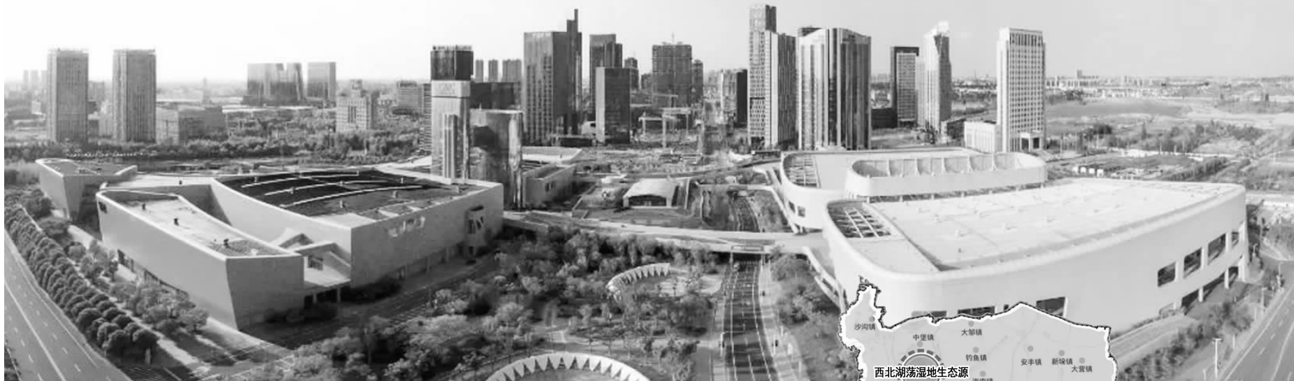
泰州的中国医药城

据上海市规划和自然资源局官方微信公众号9月15日发布的消息,上海市规划资源局总工程师孙珊带领工作组一行来到泰州,共商上海大都市圈国土空间总体规划编制工作。这也意味着泰州迈出关键一步,将融入上海大都市圈。