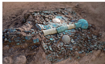
绿松石龙龙首(局部)

至今,展现在博物馆里的绿松石龙,依然没有从泥土里完整地提取出来,下半部分仍埋在土里,部分地保持着三千多年来的保存状态。