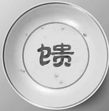
大地馈赠 拒绝浪费