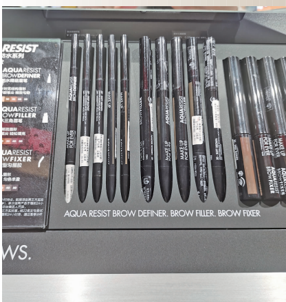
珂拉琪专柜,一款防水三角眉笔售价230元