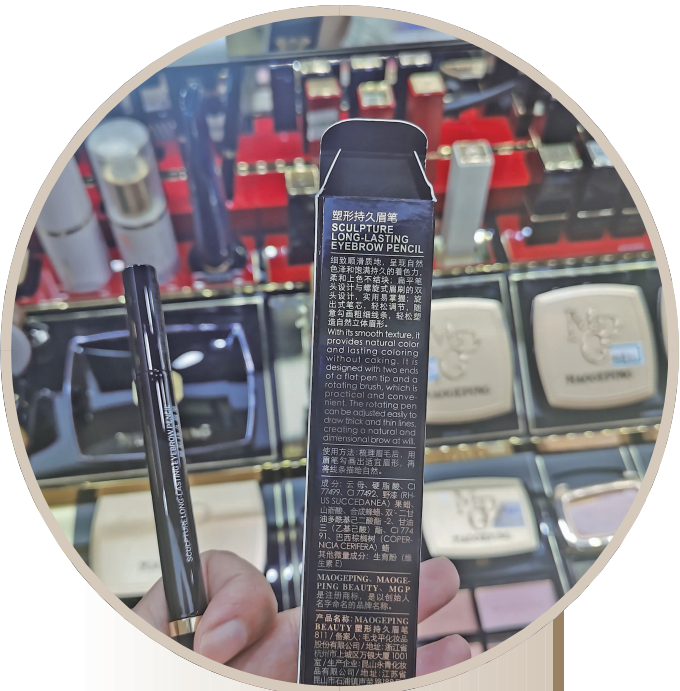
毛戈平塑形持久眉笔,专柜价220元

9月11日晚,李佳琦“道歉事件”成为热搜第一的同时,花西子品牌也备受关注,“花西子为国外品牌”“花西子有多贵”等词被网友顶上热搜榜前列。9月12日下午,花西子回应多个传闻,并就相关谣言向警方报案。再次回到争议的焦点——79元的花西子眉粉笔到底贵不贵?现代快报记者进行探访调查。