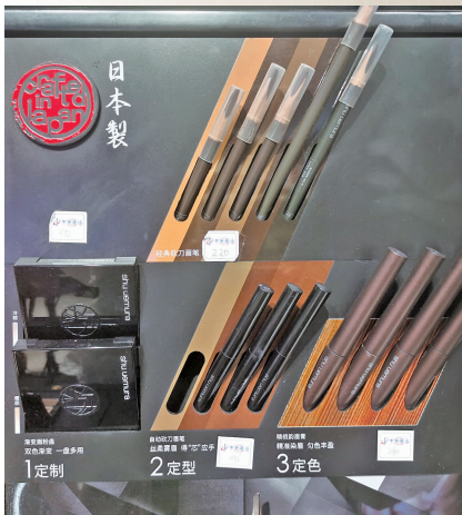
植村秀专柜,经典硬质砍刀眉笔到手价195.5元

《报告》中的调研数据显示,影响消费者购买国潮美妆品牌的关键因素是产品质量(68.57%)、产品价格(58.62%)、功效(54.91%)及产品成分(53.32%)。在国潮美妆未来提升方面,有58.85%的消费者认为国潮美妆应提高售后服务的质量。