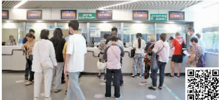
市民排队挂号、缴费(扫码看视频)