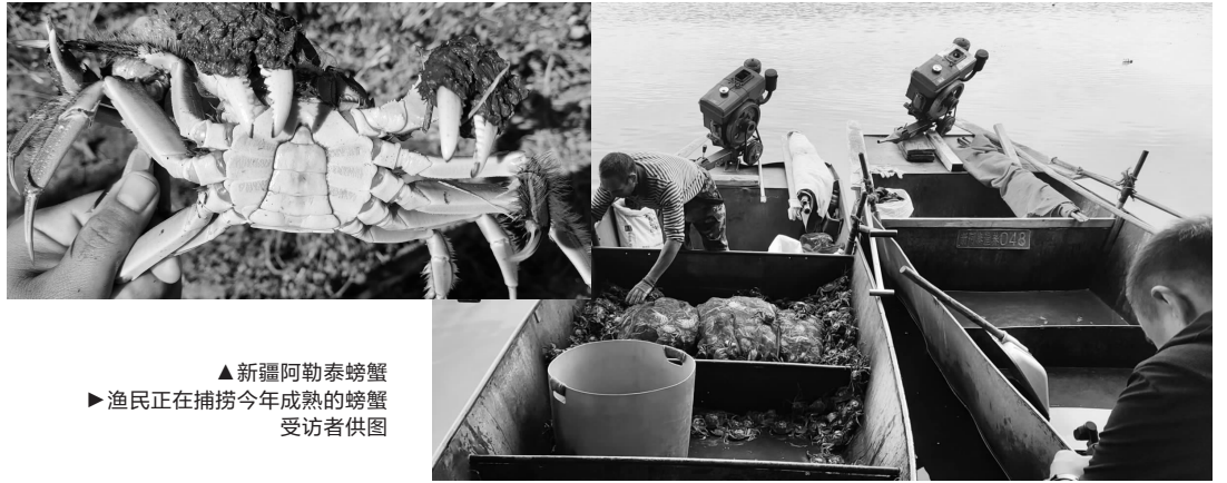
▲新疆阿勒泰螃蟹 渔民正在捕捞今年成熟的螃蟹