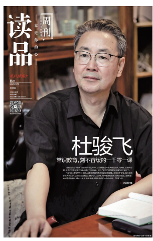
读品周刊本期看点