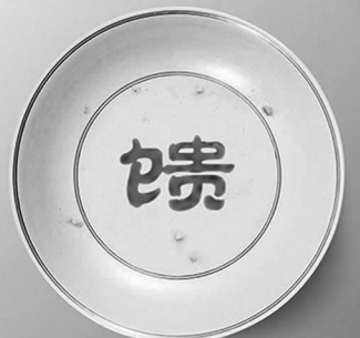
大地馈赠 拒绝浪费