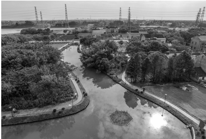
今年至7月已有141条河湖出新