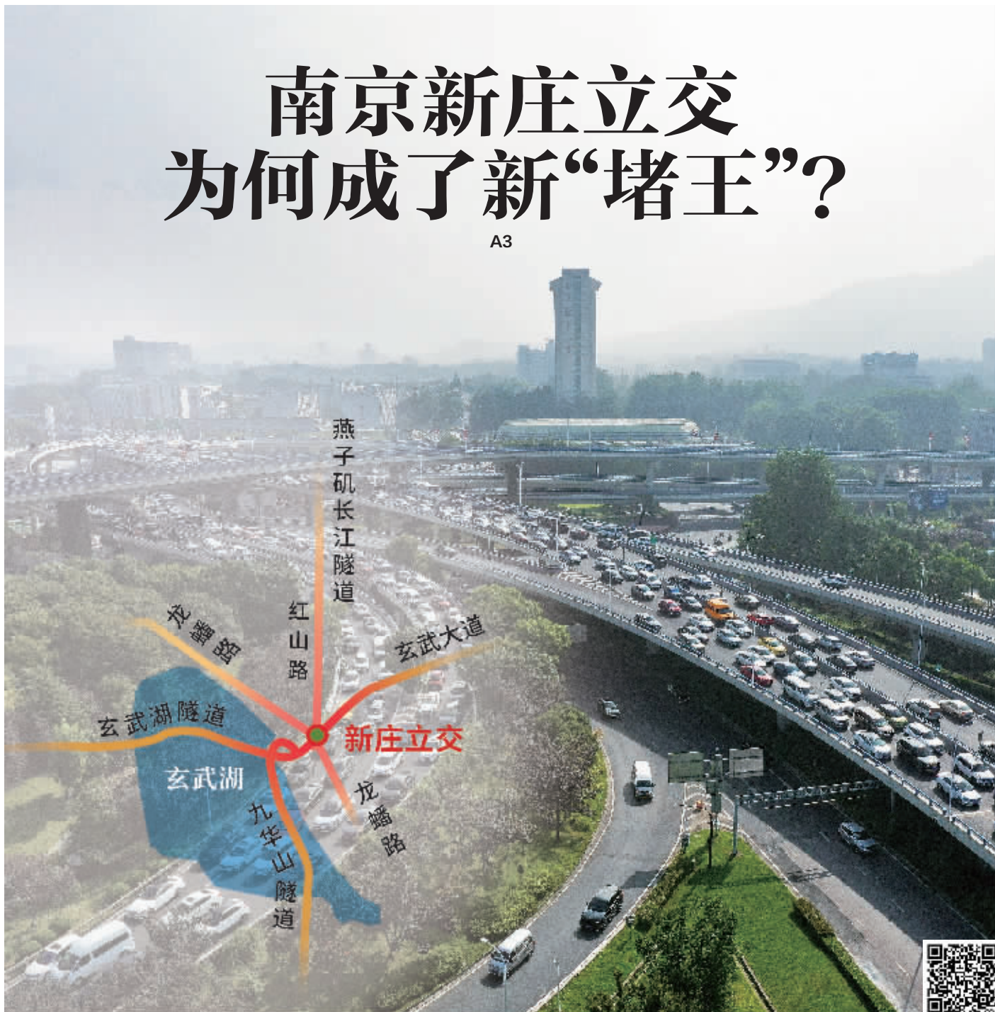
南京新庄立交早高峰这样的拥堵已是常态 扫码看视频