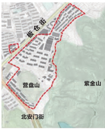
南京电影机械厂一般历史地段研究范围

西至板仓街,北至板仓街49号小区,面积约4.05公顷。具体来说,保护厂在山边,山在厂中,依山就势的空间格局,一字+环的林荫道格局保存较完整。保护历史建筑2处厂房、工业构筑物3处,2处烟囱、1处防空洞,其中北侧1处烟囱已损坏。保护林荫道4条,老(大)树95棵,小品雕塑1处,为喷泉池,已损坏。同时保护电影机械工业产业和企业文化。