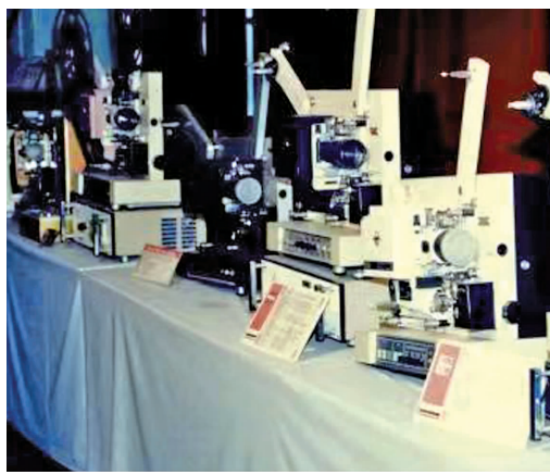
长江牌系列放映机