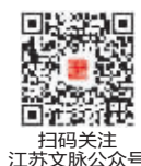
扫码关注 江苏文脉公众号