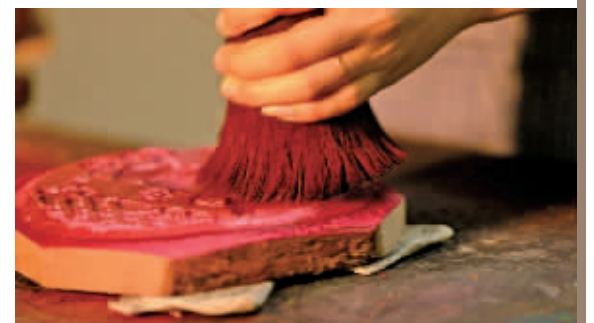
彩色套印苏州桃花坞木版年画