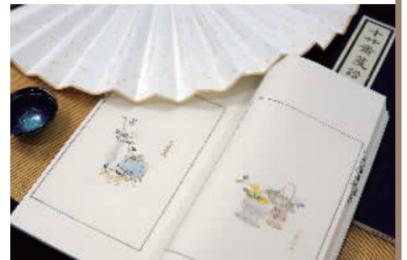
十竹斋笺谱

桃花坞木版年画也是彩色套印,具有一版一色的特点,构图丰满,造型夸张,色彩鲜艳,具有强烈的地方风格和民族特色。与十竹斋的雅丽不同,桃花坞木版年画题材更丰富,有人物、山水、花鸟、民间传说,还有戏文故事及装饰图案等,展现欢乐气氛。