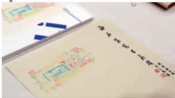
彩色套印一座藏书楼