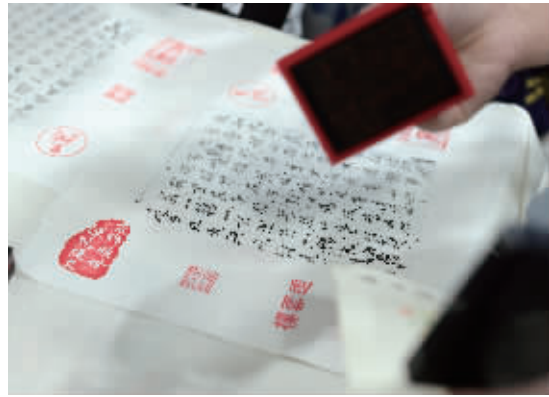
在南图“过云楼”展体验雕版印刷和集章