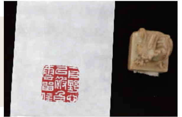
“一片野心已被白云留住”印章