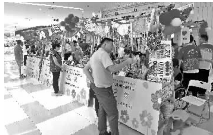
义卖市集

快报讯(通讯员 施参莲 记者 杜雪迎)8月28日下午,“公益助残小善大爱你我同行”南京市残疾人福利基金会2023年网络募捐活动启动仪式举行,标志着南京“中华慈善日”和“99公益日”网络募捐活动正式拉开帷幕。